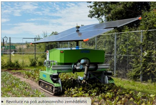
■ Revoluce na poli autonomního zemědělství